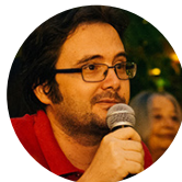
un cristian Editor