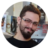
Bogdan-Alexandru Tudor Producție